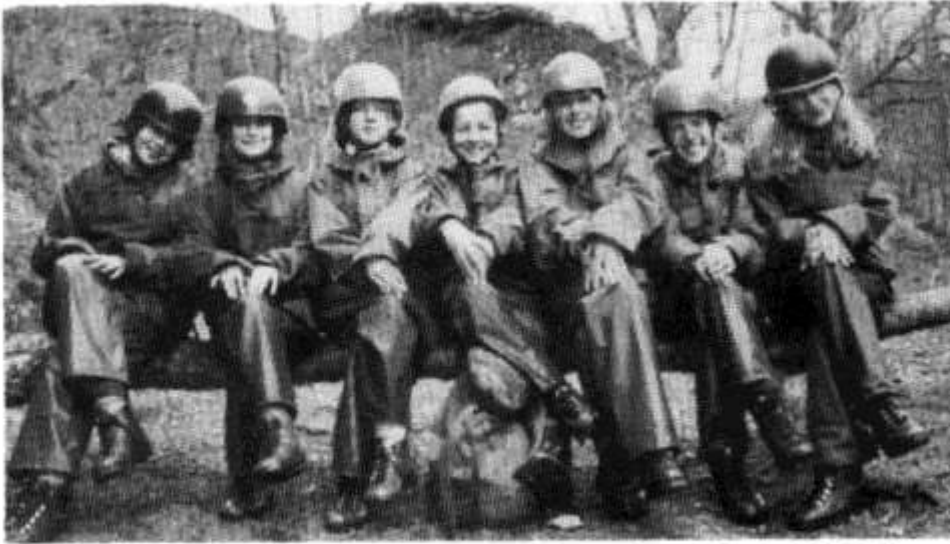
Storey Arms - Merched Bl. 8 Glan-taf

Yn ddiweddar trefnwyd trip gan yr Urdd yn Ne Morgannwg ar gyferdisgyblion blynyddoedd 7 ac 8 Glantaf i Storey Arms. Mae'r ganolfan awyr-gored wedi ryw 60 kilometr o Gaerdydd yng nghanol harddwch a phrydferthwch un o ardaloedd tlysa Cymru, sef Bannau Brycheiniog. Aeth 25 o ddisgyblion Glan-taf i'r ganolfan gan gymryd rhan mewn amryw o weithgareddau cyffrous gan gynnwys canwio, mynydda, dringo creigiau, ogofa a chyfeiriadu. Dyma lun o ferched blwyddyn 8 yn cymryd hoe yn ystod gweithgareddau dydd Sadwrn.