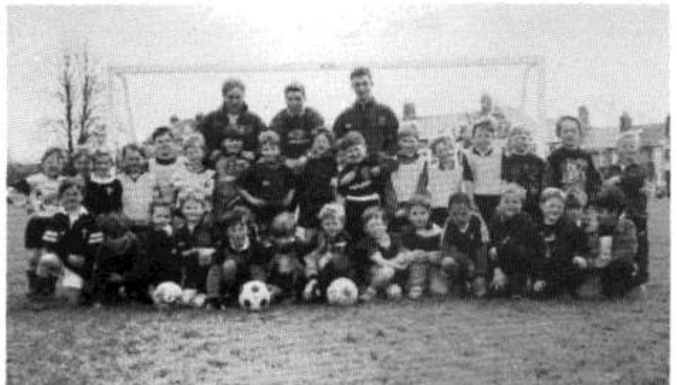
Ysgol bêl-droed iau yr Urdd

Mae'r Urdd yn rhedeg Clwb Pêl-droed bob bore Sadwrn ar gyfer blynyddoedd 1 a 2 rhwng 9.00a.m. - 10.00a.m. ar Gaeau Llandaf, ac yna i fechgyn blynyddoedd 3, 4, 5 a 6 rhwng 10.00 - 11.00a.m.