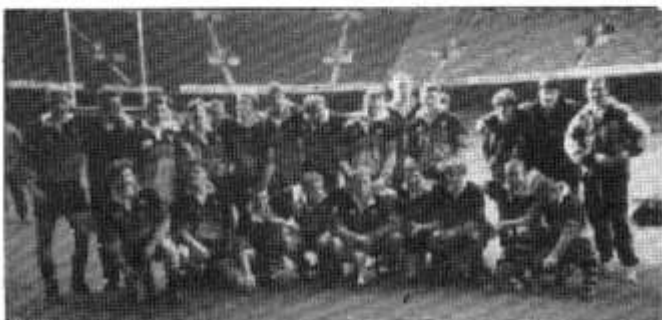
Tim buddugol Glan-taf o dan 18 1996