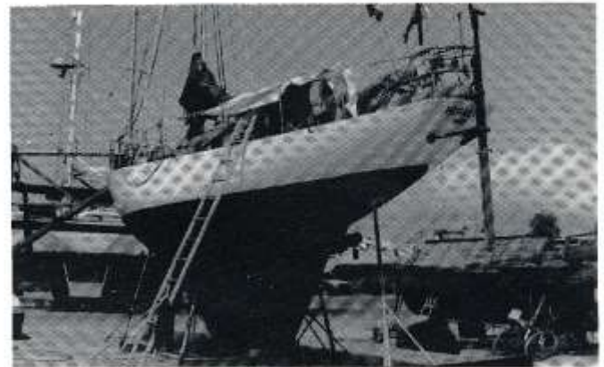
Atgyweirio llyw Hiraeth yn Darwin, Awstralia

Roeddwn yn disgwyl fy nheulu i dreulio'r Nadolig gyda mi ar y cwch, a golchais y dillad gwely a'r hwyliau a'u gadael i sychu yn yr haul. Ac i ffwrdd â mi i'r farchnad. Ond pan ddychwelais, roedd haenen ddu fel huddugl dros bopeth: roedd dyn gerllaw o Gorea wedi bod yn gwneud paent a'r gwynt wedi ei chwythu i bob cyfeiriad. Ond chwarae teg i'r Coreaid, roedden nhw'n sylweddoli fy mhlenbleth, a glanhawyd y llong a phopeth arni nes oedd hi'n edrych fel pin mewn papur.