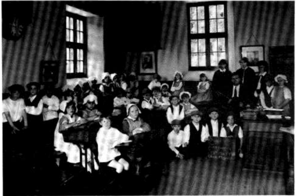
Sain Ffagan, Mai 1996

Ymwelodd rhai o blant yr Adran Iau â Neuadd Dewi Sant. Yno cawsant gyfle i glywed ac i greu cerddoriaeth go wahanol, Cerddoriaeth Gamelau. Bu'r plant wrthi'n ddiwyd yn creu melodïau. Dysgwyd llawer am gefndir yr offerynnau, a'r gwledydd lle y cânt eu chwarae.