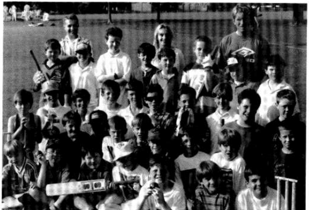
Aelodau Clwb Criced Nos Iau