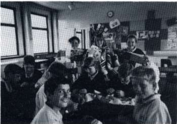
Plant Blwyddyn 8 a'u cwiltiau

Yn ddiweddar bu plant Blwyddyn 8 wrthi'n brysur yn gwneud cwiltiau a theganau i'w hanfon i Bosnia a Rwmania. Cafodd y plant hwyl a boddhad yn gwneud y gwaith ac mae'n siŵr y bydd plant anghenus y gwledydd yma wrth eu bodd yn eu derbyn. Mrs Eluned Norton fu'n cyfarwyddo'r gwaith.