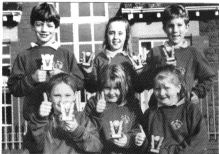
Rhai o nofwyr Ysgol Pen-cae