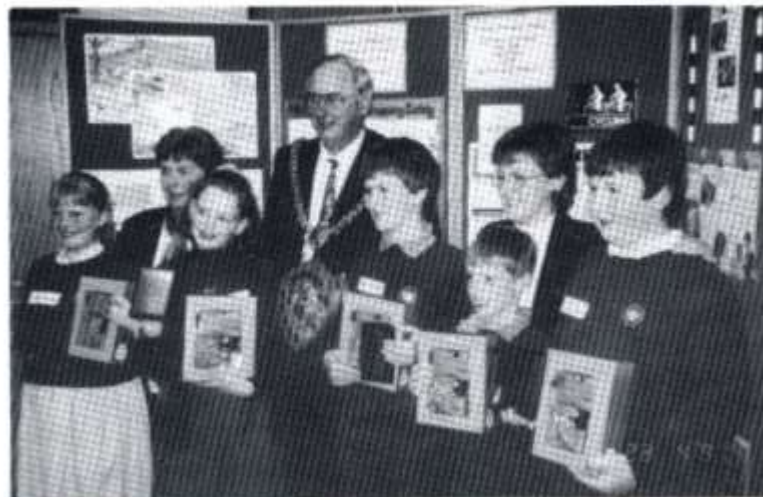
Y tim buddugol gyda'r Arglwydd Faer