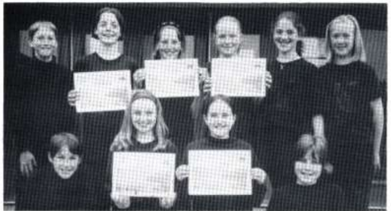
Ysgol Melin Gruffydd, enillwyr yr Ensemble Llais