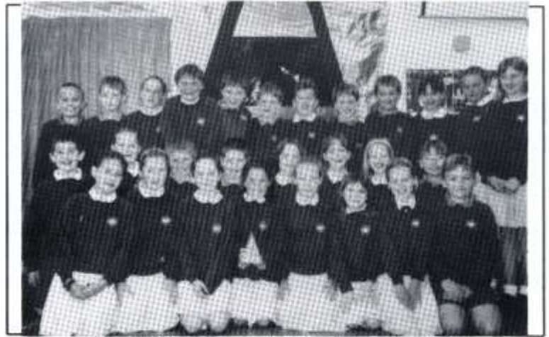
Ysgol Y Wern, enillwyr y Grŵp Cerddoriaeth Greadigol