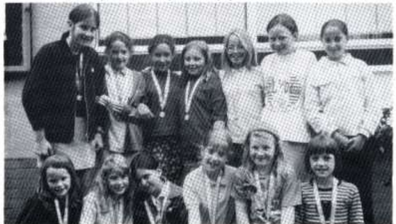
Ysgol Treganna, enillwyr y Grŵp Llefaru Bl. 6 ac iau