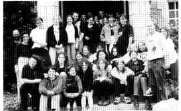
Y criw a fu yn Landerneau