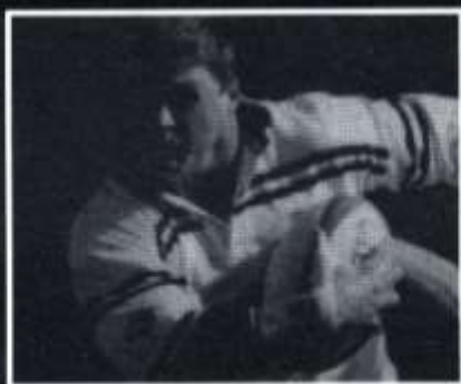
Y CLWB RYGBI