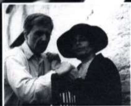
Y PALMANT AUR