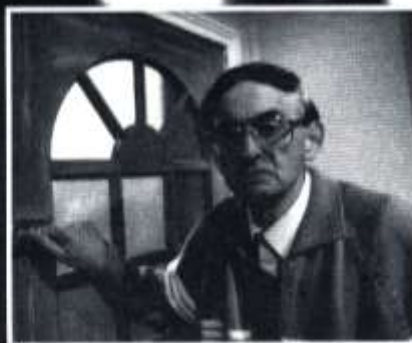
OS BYW AC IACH