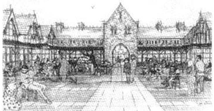
Llun artist o'r Mews ar ei newydd wedd

yn cynnig i fyfyrwyr gyfleusterau sydd gyda'r gorau o blith unrhyw goleg cerdd a drama ym Mhrydain heddiw. Bydd yr ystablau presennol yn cael eu troi'n dair neuadd berfformio, gan gynnig amgylchfyd sensitif, artistig a diwylliannol er budd myfyrwyr a'r cyhoedd fel ei gilydd. Bydd sgwâr mewnol y Mews yn cael ei atgyweirio, gan ddarparu canolfan perfformio awyr-agored arall i ganol y brifddinas.