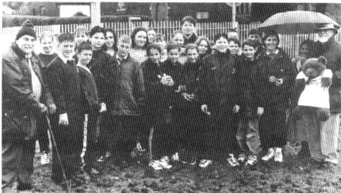
Plannu cennin Pedr yn Ysgol Glantaf.

arian i elusen Marie Curie. Am bob punt a godwyd rhoddodd yr elusen un byl b cennin Pedr. Llwyddodd y plant i godi dros £2,700 - felly roedd tipyn o blannu i'w wneud! Cynigiodd Canolfan Garddio Pughs gynorthwyo gyda'r plannu a mawr yw diolch yr ysgol iddynt. Rhannwyd y bylbiau rhwng Glantaf a Phlasmawr ac edrychwn ymlaen i weld ffrwyth y llafur yn y gwanwyn.