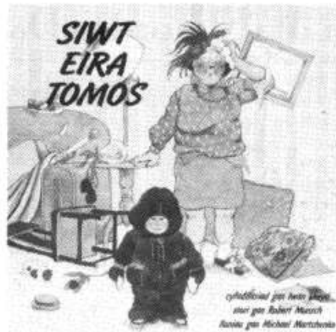
Llun o'r Llyfr Siwt Eira Tomos