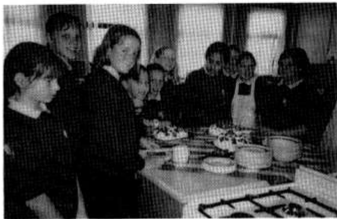
Y Clwb Coginio wrth eu gwaith