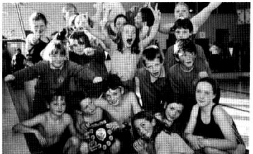
Enillwyr tarian gala nofio yr Urdd o Ysgol Pencae