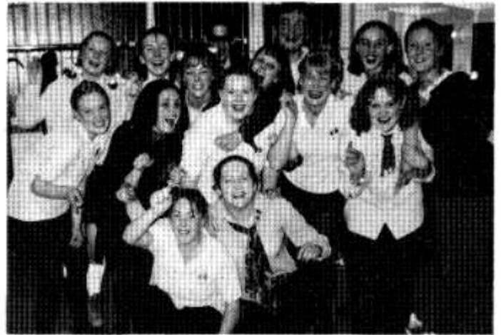
Aelodau 'Y Gweithdy'.

Aeth yr ymarferion yn eu blaen, ac weithiau roedd gofyn i ni fod yna dair gwaith yr wythnos, ac am 8 awr ddydd