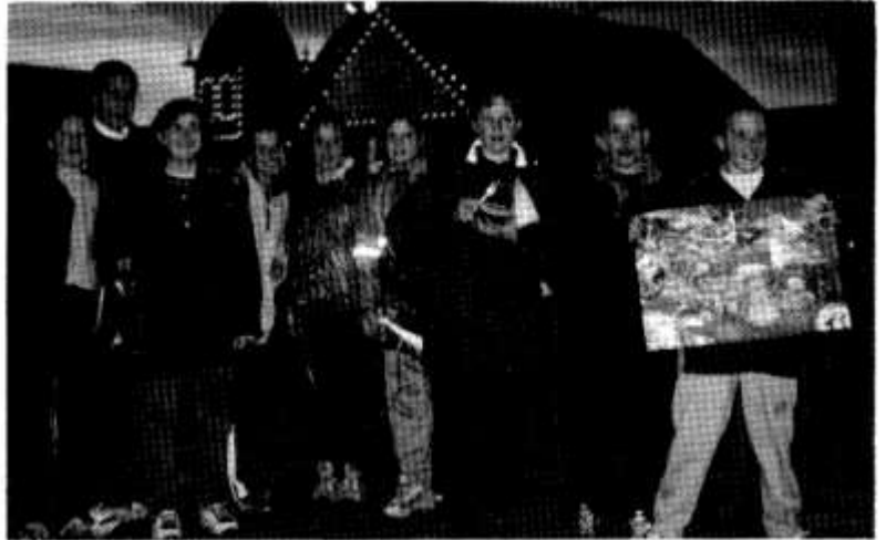
Plant ysgolion Plasmawr a Glantaf yn Alton Towers