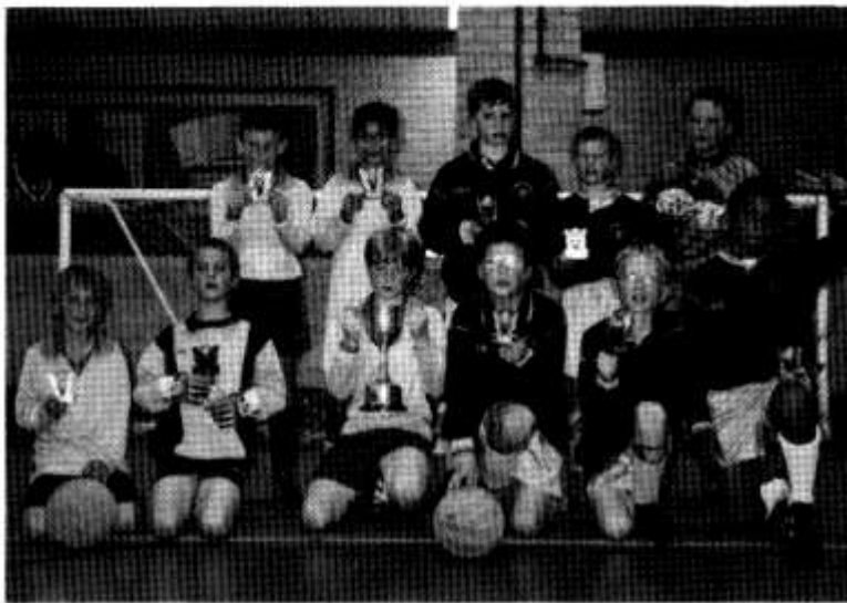
Timau pêl-droed Eglwys Newydd ac Allensbank