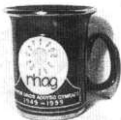
Dathlu twf addysg Gymraeg yn y ddinas - gweler tud 6