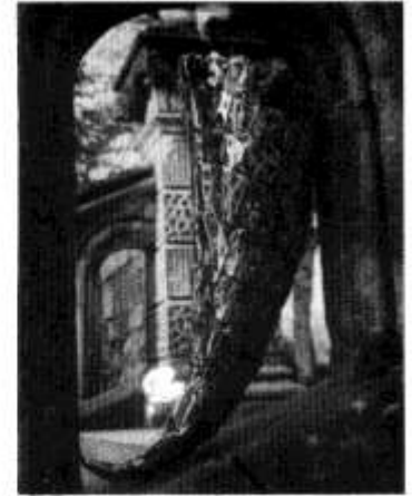
Fflag Fflam yr Iaith