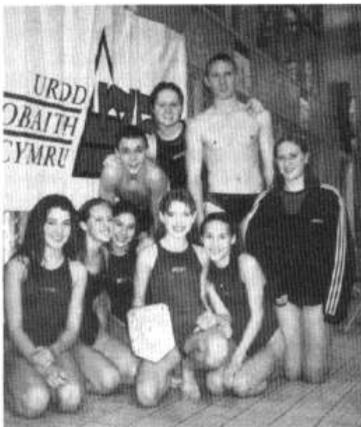
Ysgol Cardiff High, enillwyr tarian y Gala Nofio Uwchradd

Ychydig cyn y Nadolig cynhaliwyd Cystadleuaeth Pêl-rwyd yr Urdd ar gyfer ysgolion Caerdydd a'r Fro. Cafwyd ymateb da iawn gyda dros 20 o dimau yn cymryd rhan. Ysgol Gynradd Eglwys Newydd a enillodd y gystadleuaeth a byddent nawr yn mynd ymlaen i gynrychioli'r sir yn y gystadleuaeth genedlaethol yn Aberystwyth fis Mai. Hoffai'r Urdd ddiolch i ysgolion, Coed y Gof, Bro Eirwg, Allensbank, Llanisien Fach, Eglwys Newydd, Eglwys Wen, Rhydypennau, Pen-cae, St Joseph's, Treganna, Marlborough a Iolo Morganwg am eu cefnogaeth.