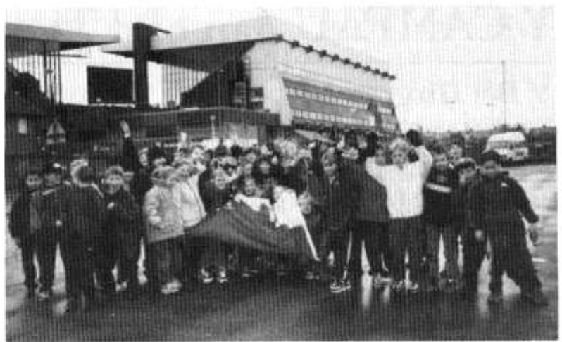
Trip i weld Manchester United