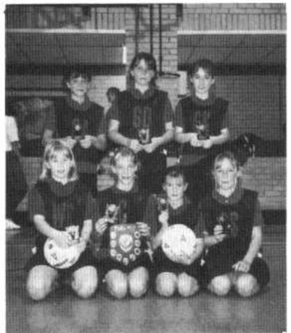
Ysgol Eglwys Newydd, enillwyr y cystadleuaeth pêl-rwyd