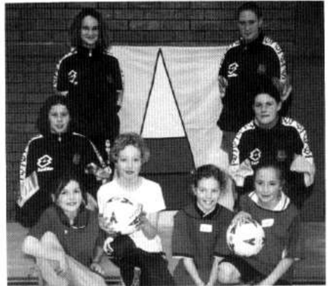
Cwrs pêl-droed yr Urdd i ferched gyda rhai aelodau o dim pêl-droed merched dan 16 oed Cymru