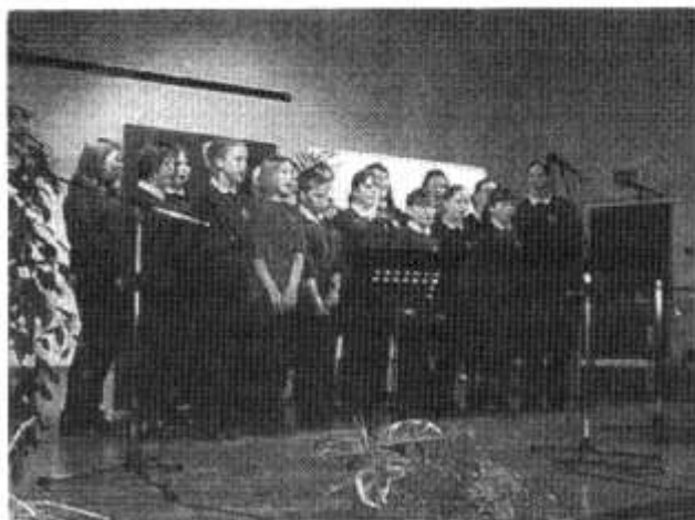
Rhai perfformwyr Eisteddfod cyntaf Plasmawr