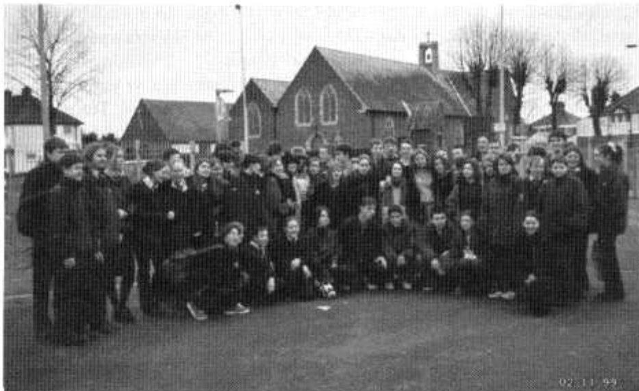
Ffarwelio â'r Llydawyr ym maes parcio Glantaf