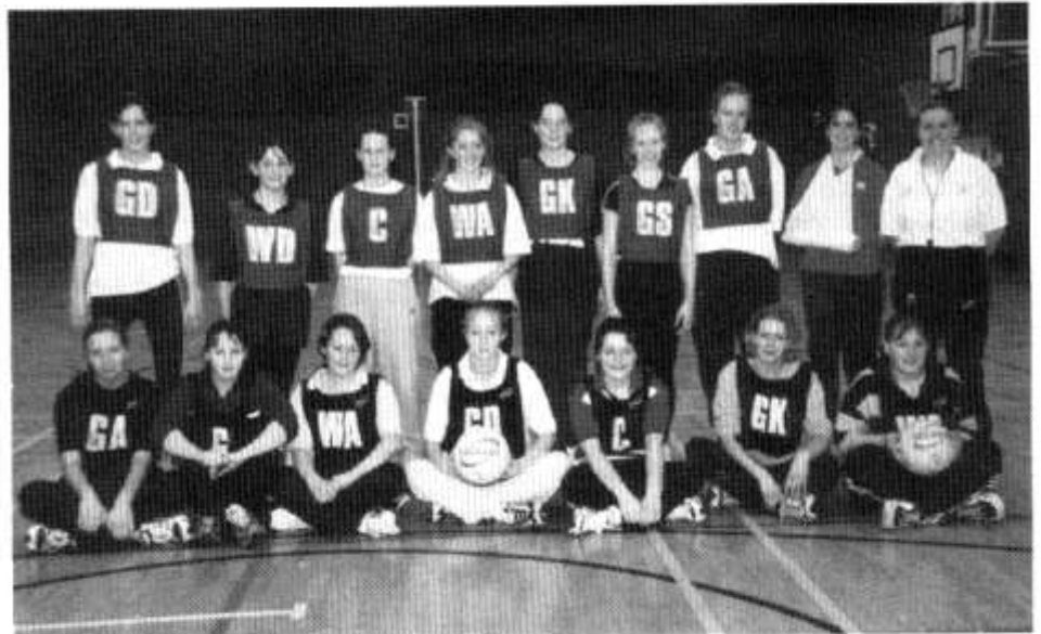
Cwrs Hyfforddi Pêl-rwyd 16+

Cafwyd ymateb gwych i'r diwrnod ac ar ddiwedd y dydd cafodd y merched dystysgrif yn dangos eu bod wedi llwyddo yn y cwrs i hyfforddi merched oedran cynradd. Mae'r Urdd yn barod wedi trefnu cwrs hyfforddi tennis a phêl-droed ar gyfer yr oedran 16+. Bydd mwy o gyrsiau yn cael eu trefnu yn y dyfodol wedi llwyddiant y tri hyn.