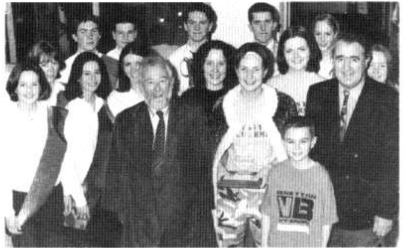
Gorsedd a phrif enillwyr cystadlaethau llenyddol Gŵyl Glantaf 1999.