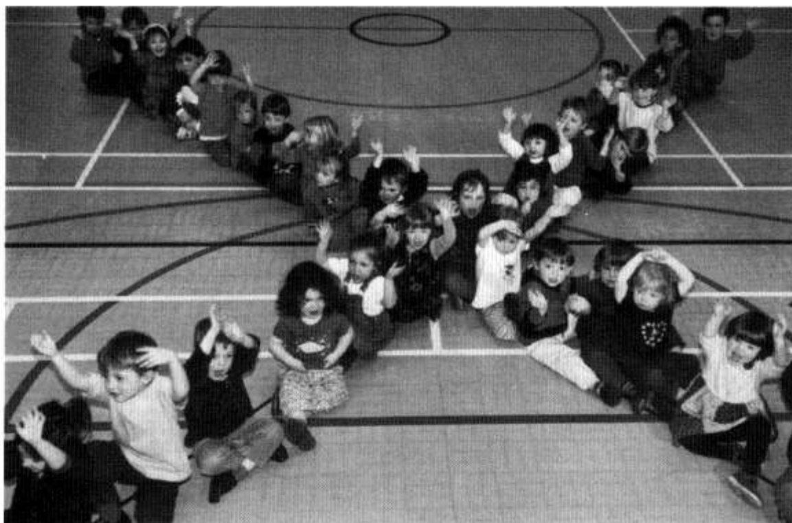
Plant Ysgol Feithrin Treganna yn croes-awu'r Gymru newydd! Un o'r trêls arbennig sydd ar S4C i gyd-fynd ag etholiadau'r cynulliad.

Mae'r dasg sydd o flaen y Cynulliad yn fawr – creu Cymru lewyrchus o ran ei heconomi a'i diwylliant, Cymru a fydd yn hyderus yn ei hunaniaeth ac ar yr un pryd yn eang ei gorwelion rhyngwladol. Anogwn yr aelodau newydd, pwy bynnag y byddont, i ymroi i'r dasg honno â'u holl egni – a phob dymuniad da iddynt yn eu swyddi allweddol a hanesyddol.