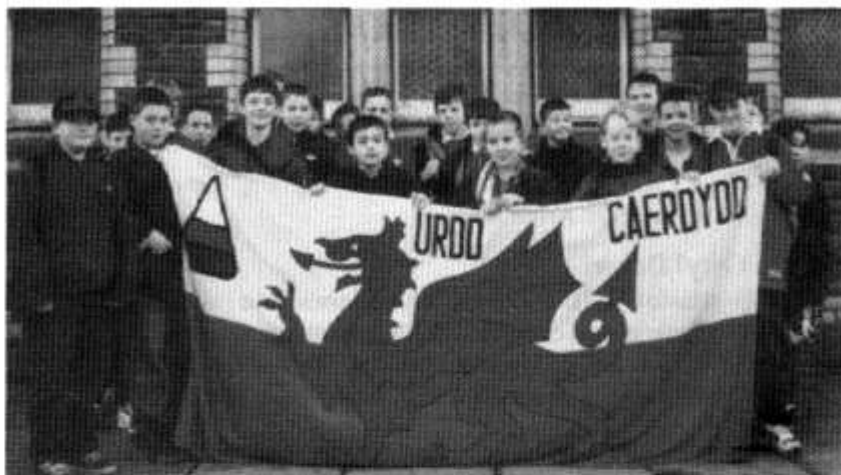
Trip yr Urdd i Wembli i weld Cymru v Iwerddon

Ddiwedd mis Chwefror trefnwyd trip i Wembli i weld Cymru'n chwarae Iwerddon. Cafwyd ymateb gwych â bws llawn o ddisgyblion Blynyddoedd 7 ac 8 Glantaf a Plasmawr yn gadael ar fore Sadwrn, 20 Chwefror i weld y gêm. Gobeithiwn drefnu trip arall yn fuan i weld Cymru'n chwarae pêl-droed. Hoffai'r Urdd ddiolch i ddisgyblion Plasmawr a Glantaf am eu hymddygiad aeddfed yn ystod y trip.