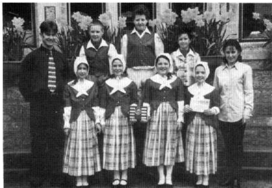
Ysgol Iolo Morganwg, enillwyr cystadleuaeth y ddawns dan 12 oed, a Thlws Cwmni CVC Caerdydd