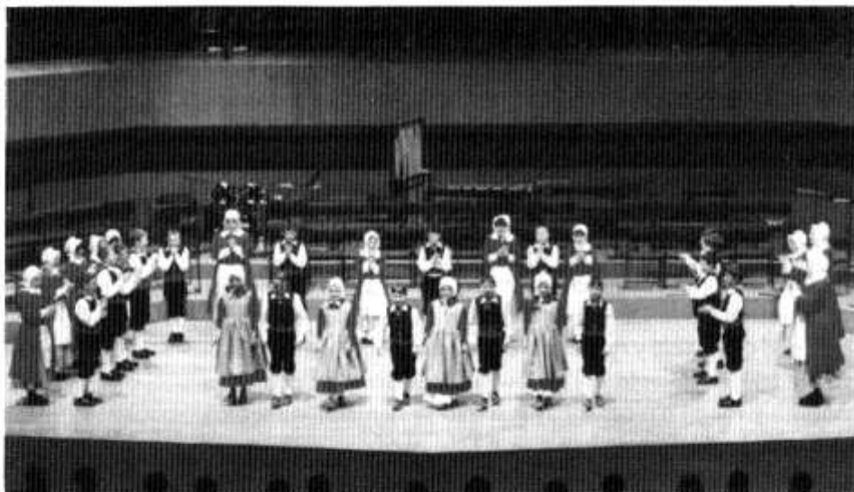
Dawnsyr Ysgol Gymraeg Pen-y-garth yn Neuadd Dewi Sant

gymuned yn cyfrannu'n ariannol a'r rhieni'n gweithio'r gwisgoedd. Gwefreiddiol oedd y dehongliad, deng munud o symud a chyd-ddawnsio graenus a phawb wrth eu bodd. Cafwyd cymorth band arbennig wedi ei greu o blith athrawon yr ysgol a ffrindiau o'r gymuned, a mawr oedd eu cyfraniad at y campwaith.