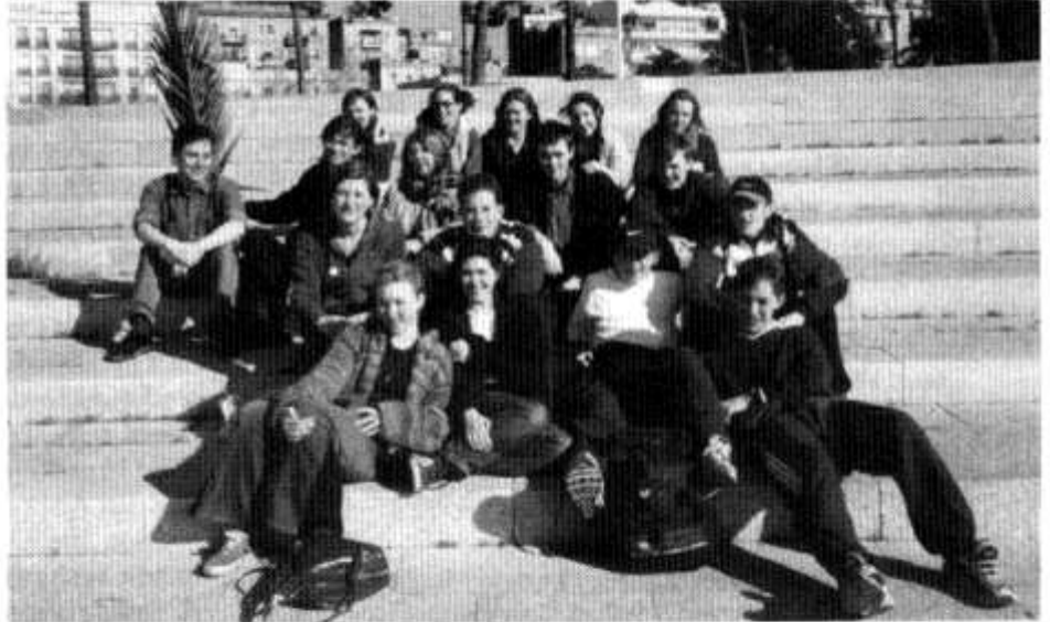
Yr Adran Gelf yn Barcelona