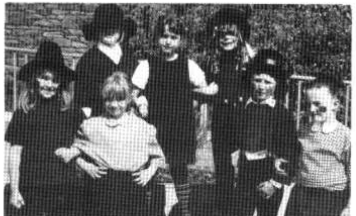
Plant y dosbarth derbyn yn eu gwsg ffansi fel un o gymeriadau cyfres ddarlenn Sali Mali.

Ar brynghawn braf ym Mehefin fe ddathlwyd pen-blwydd y cymeriad hoffus Sali Mali yn 30 oed mewn parti ym Mharc Hayley.