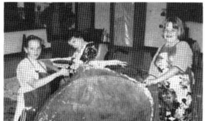
Rhai o'r disgyblion yn paratoi'r mygydau ar gyfer Yr Odesi .

Bu'n adeg cyffrous iawn ym mywyd yr ysgol wrth weld y disgyblion yn cydweithio mewn ffordd mor broffesiynol gyda'r artistiaid. Roedd yn bleser gweld disgyblion sydd ag anghenion arbennig yn gwneud eu gorau glas i gyfrannu i'r cynhyrchiad. Yn goron ar yr holl waith cafwyd dau berfformiad gwych i'r cyhoedd. Bu'n gyfle unigryw i brofi 'byd duwiau, arwyr, anghenfilod, gwaed a hiraeth. Taith un dyn adref, taith Odisiws'.