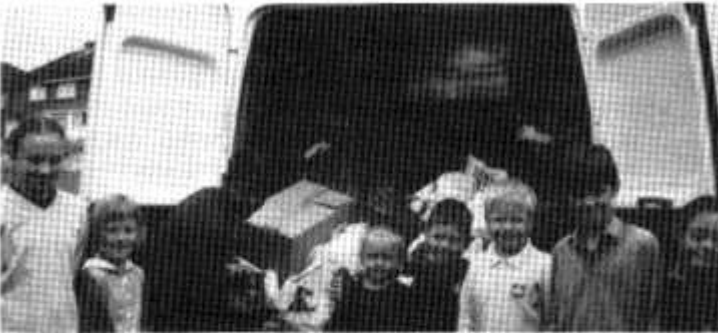
Plant Coed-y-gof yn anfon nwyddau i Kosovo.

Ar ôl clywed ceisiadau gan blant yr ysgol i ymwneud â helpu'r ffoaduriaid yn Kosovo, penderfynwyd gwneud casglaid o fwydydd sych, dillad a blancedi ar gyfer yr apêl. Roedd yr ymateb yn anhygoel. Diolch i chi, blant a rheini hael, a phawb a fu yn trefnu a dosbarthu'r nwyddau. Roedd hi'n fraint cael bod yn rhan o'r fenter.