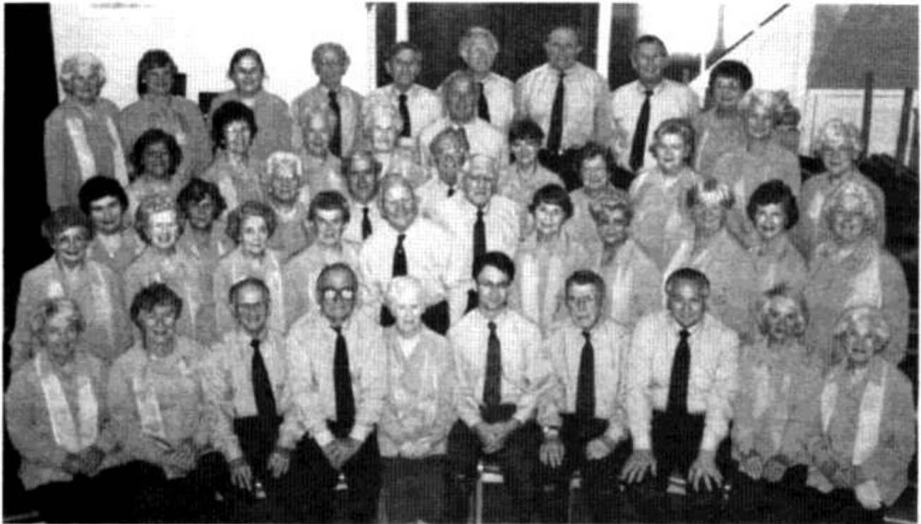
Cŵr Aelwyd Hamdden Caerdydd