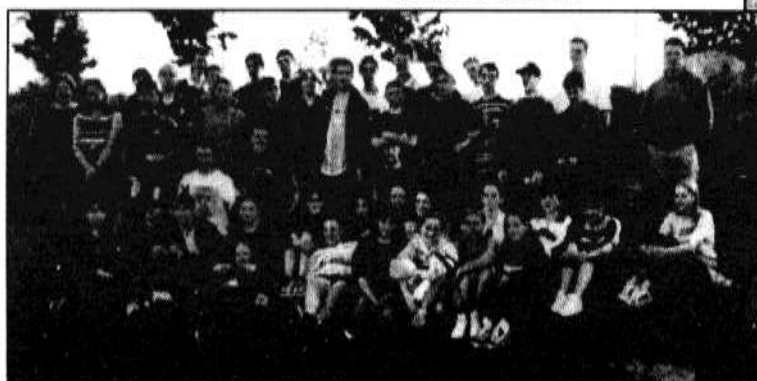
Disgyblion Blwyddyn 9 yn Ngwlad Belg