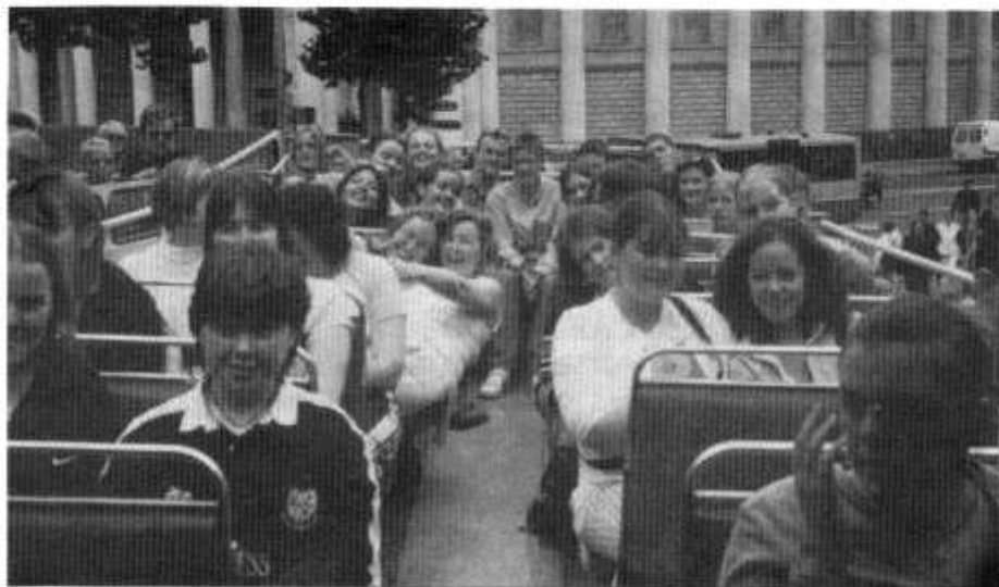
Ar y bws yn Nulyn

disgyblion Blwyddyn 11 ysgolion Glantaf a Chwm Rhymini ar y cyd i Gaernarfon. Yn ystod y trip, gwnaethom ymweld â'r Wyddfa, Beddgelert, prynhawn yn ymlacio ar y traeth ym Mhorthmadog a diwrnod yn Nulyn, Iwerddon. Cafwyd ymateb gwych i'r trip gyda dros 30 o ddisgyblion yn mynychu. Hoffai'r Urdd ddiolch i griw Glantaf am eu hymddygiad aeddfed a chymdeithasol yn ystod y trip.