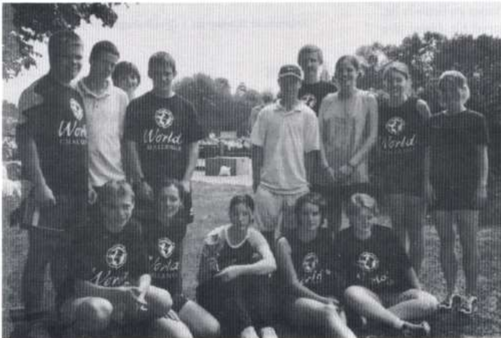
Rhai o'r rhedwyr a fu'n cludo Fflam Addysg Gymraeg o gwmpas ysgolion Cymraeg Caerdydd ar 9 Gorffennaf.

Ar y caeau rygbi, bechgyn ifanca'r ysgol ac yn enwedig tîm addawol iawn Bl. 7 sydd wedi profi'r llwyddiant mwyaf drwy ennill 4 allan o 5 gêm gan guro timau A a B Glantaf. Mae bechgyn Bl. 8 a 9 wedi cael dechrau cymysg i'r tymor gyda'r ddau dîm yn ennill 2 allan o 4 gêm a'r ddau yn cael buddugoliaeth dda yn erbyn Radur. Er y brwydro caled mae Bl. 10 yn aros am eu buddugoliaeth gyntaf eleni. Gyda mwy o ymarfer, llwyddiant a ddaw!