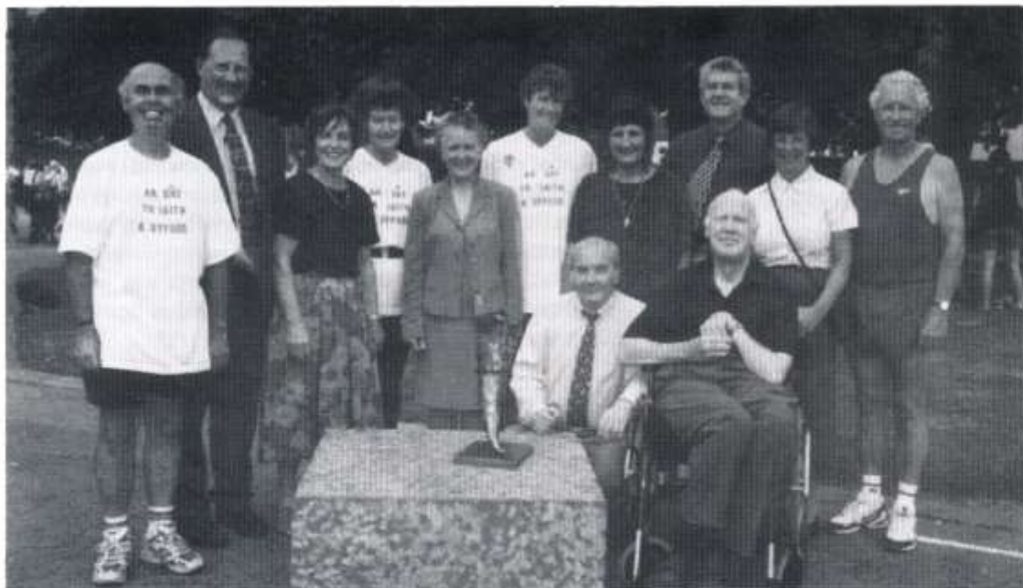
Rhai o Gymry Cymraeg 'brodorol' Caerdydd, y rhan fwyaf ohonynt ymhlith disgyblion cyntaf ysgol gynradd Gymraeg gyntaf Caerdydd, yn Ysgol Gyfun Glantaf i ddathlu diwedd Taith y Fflam, 9 Gorffennaf 1999.