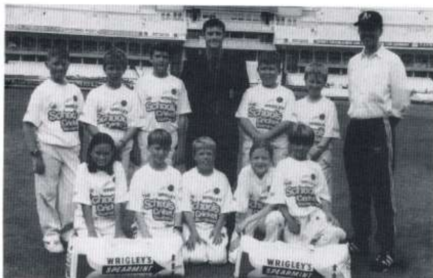
Tim buddugol Melin Gruffydd '99

Nid yn unig hynny, ond mae Melin Gruffydd wedi mynd ymlaen o'r gystadleuaeth sirol i fod yn Bencampwyr De Cymru ddwy flynedd yn olynol, yn 1998 a 1999. Golyga hyn i'r ysgol gael y fraint o gynrychioli De Cymru - y llynedd yn Edgbaston ac eleni yn Trent Bridge - ym Mhencampwriaethau Prydain. Dim ond o drwch blewyn - ar y bêl olaf - y methodd Melin Gruffydd gyrraedd y rownd gyn-derfynol.