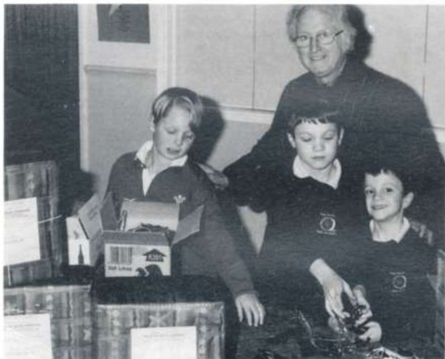
Havard Gregory yn cael cymorth tri o blant Eglwys Minny Street i anfon sbectol i Fadagascar. Gweler tud. 5