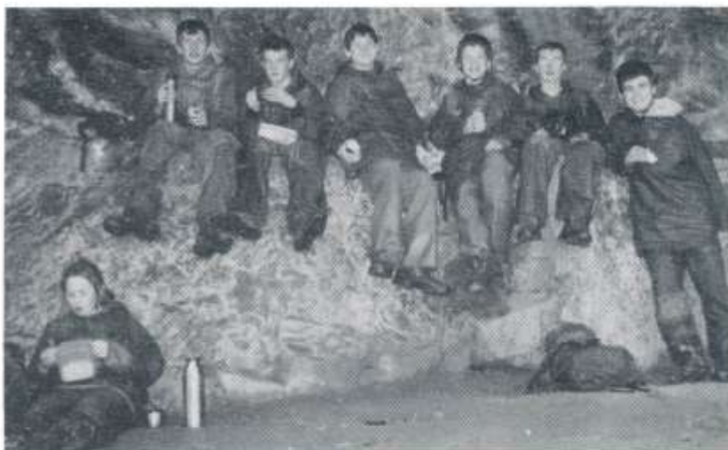
Rhai o blant Ysgol Glantaf ar y Bannau