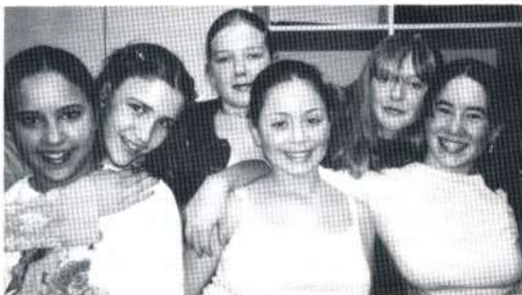
Rhai o fodolau'r Sioe Ffasiynau