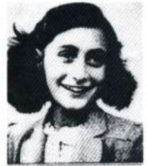
Anne Frank ym Mai 1942