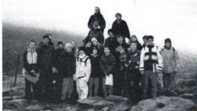
Cwm Idwal - Peiran Rhewlifol

cyfle i ymweld â Chwm Idwal. Roedd y trec i fyny'r mynydd yn un a oedd yn peri trafferthion i rai, gan gynnwys fi, ond gwefreiddiol oedd y gair a ddewisodd pawb i ddisgrifio'r olygfa pan gyrhaeddodd ni'r peiran. Roedd hi'n pigo bwrw glaw a'r gwynt yn chwythu'n gryf ond doedd y tywydd garw ddim yn gallu lleihau'r wefr o weld yr olygfa odidog hon. Ar y cyfan roedd y dysgu'n llawn hwyl a ninnau'n mwynhau pob eiliad o'r profiad.