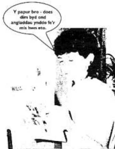
Un o luniau Cymraeg Da

Oes angen llyfr gramadeg newydd? Oes, oes, oes! Rwy'n gwybod nad yw hi'n ffasiynol dysgu gramadeg y dyddiau 'ma,