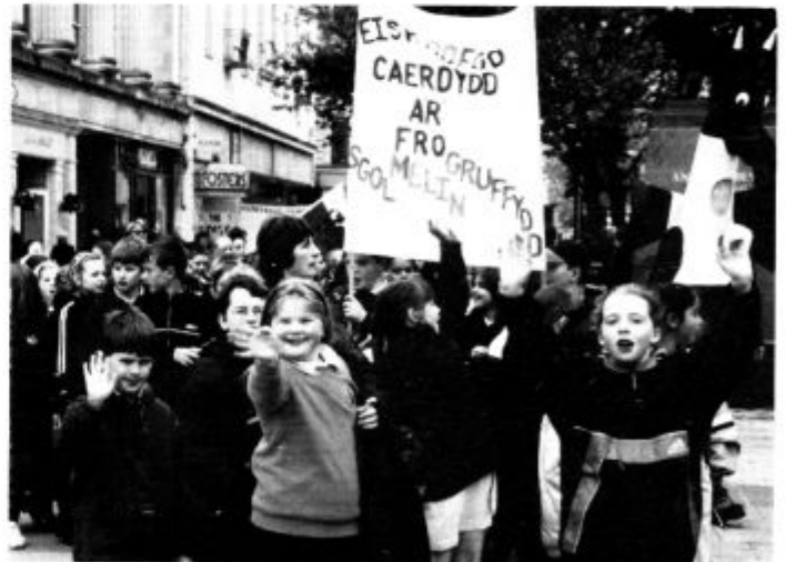
Gŵyl Cyhoeddi Eisteddfod yr Urdd Caerdydd a'r Fro, Mai 2000