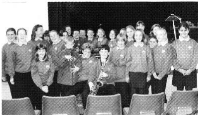
Disgyblion Ysgol Bro Morgannwg