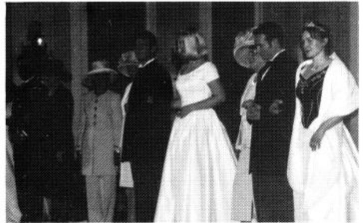
Sioe Ffasiynau yn Neuadd y Ddinas i godi arian at Eisteddfod yr Urdd 2001