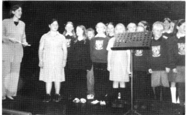
Cyngerdd yr Urdd

Mae'r sbri wedi dechrau eisoes yng nghylch y brifddinas, gydag ysgolion Penarth wedi bod wrthi yn codi arian ac yn ymarfer eu doniau cerddorol yn barod. Yn ystod mis Hydref, cynhaliwyd cyngerdd yn Ysgol Stanwell, Penarth, gydag Ysgol Gymraeg Penygarth a'i gôr nodedig, ynghyd â disgyblion o ysgolion eraill y dref, yn dathlu dyfodiad yr Ŵyl.