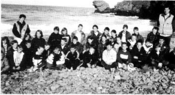
Plant Ysgol Penygarth, Penarth, yn mwynhau cael eu haddysgu ar lan y lli yn Llangrannog.

Bu plant blynyddoedd 5 a 6 Ysgol Penygarth, Penarth ar lan y lli yn ddiweddar, yn profi gwledd o Gymreictod ar gwrs iaith o wythnos yng ngwersyll yr Urdd yn Llangrannog.