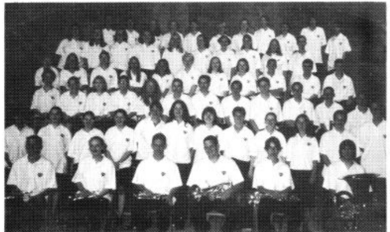
Criw Ysgol Glantaf ym Marcelona