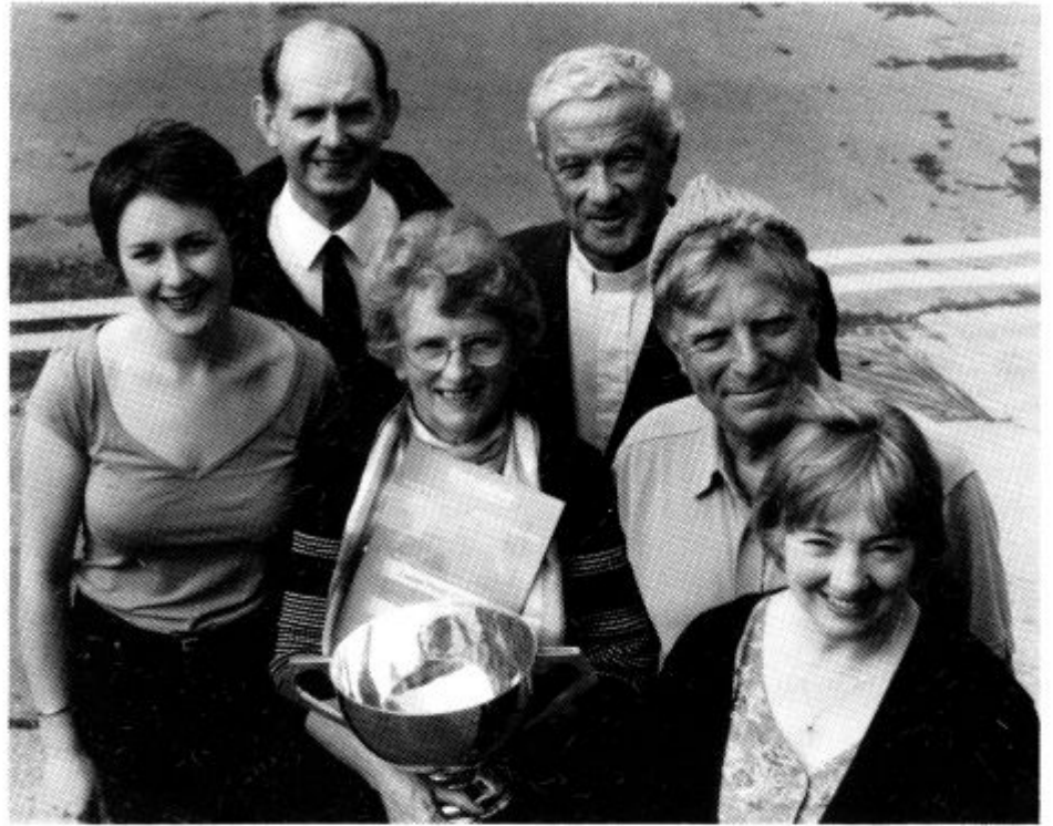
Cwmni Drama'r Crwys gyda Thlws yr Eisteddfod

Pan symudodd Eglwys y Crwys o Heol y Crwys i'w safle presennol yn Heol Richmond, gwelwyd y posibiladau o addasu y llofft, a oedd yng nghefn yr adeilad, yn theatr fechan. Aethpwyd ymlaen ar gwaith ac erbyn hyn mae'r cwmni yn gallu ymarfer a pherfformio yn ei theatr ei hunan, theatr sy'n eistedd pedwar ugain o gynulleidfa. Mae'r cyfleusterau yma, yn cynnwys offer sain a goleuadau, yn cael eu defnyddio nid yn unig gan Theatr y Crwys ond hefyd gan gwmnïau eraill, megis Minny Street a Phrifysgol Caerdydd. Mae'r Cwmni yn llwyfannu amryw o gynhyrchiadau bob blwyddyn, rhai ar gyfer y capel a rhai ar gyfer y cyhoedd yn gyffredinol. Y llynedd, fel y cofiwch, dramâu byrion oedd