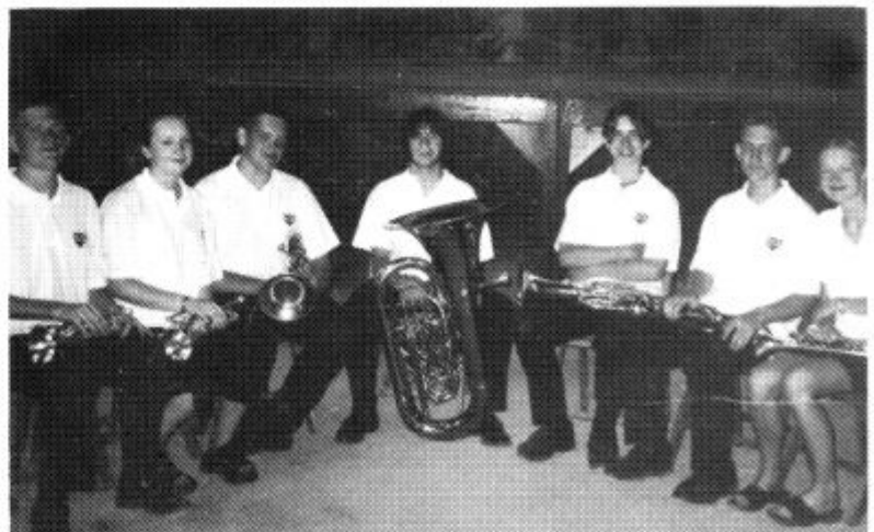
Rhai o'r chwythwyr ar y daith