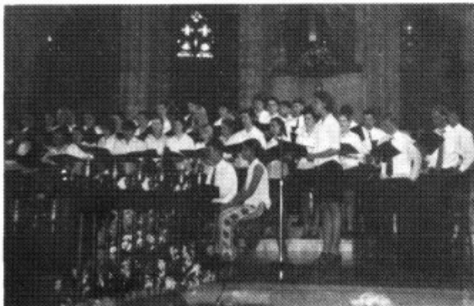
Perfformio yn Eglwys Gadeiriol Barcelona