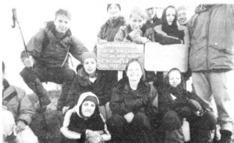
Concro Mynydd Kinabalu!

EISTEDDFOD GENEDLAETHOL URDD GOBAITH CYMRU