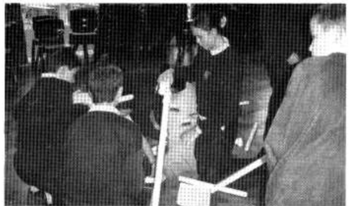
Llun o'r disgyblion yn mwynhau'r adeiladu.

Ar ddiwedd y dydd daeth yr amser i wobrwyo. Llwyddodd y tîm i gael mwy o bwytiau na phawb arall ac enillwyd £50 ar gyfer yr ysgol.