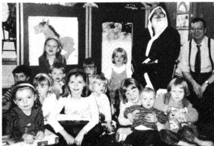
Dosbarth iau Ysgol Sul Bethel, Rhiwbina wrth eu bodd yn derbyn eu hanrhegion nadolig gan Siôn Corn.