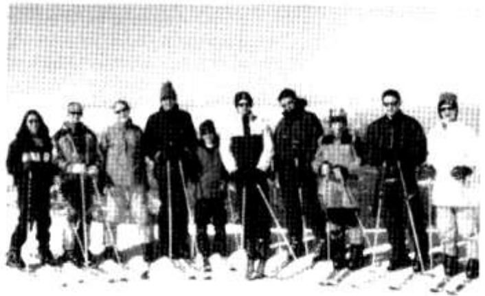
Y criw yn mwynhau yn Ffrainc