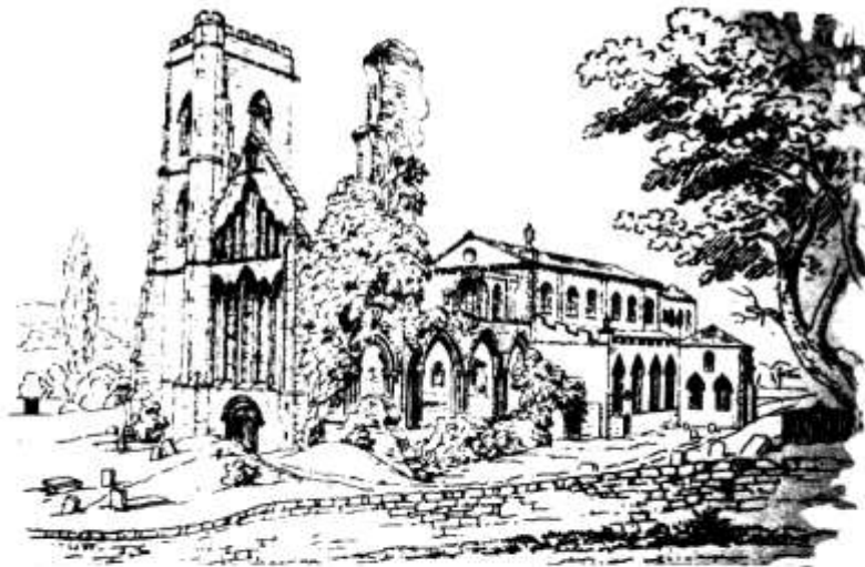
Cadeirlan Llandaf 'slawer dydd

mae dod i barchu ein gilydd. Os ydym i dyfu i fod yn gymdeithas gynhwysol mae'n rhaid i ni fod yn agored i eraill a chroesawu eu hetifeddiaeth ddiwylliannol. Ac mae'r Eglwys yn fan ardderchog i gychwyn y broses hon. Awn ymlaen mewn ffydd felly.