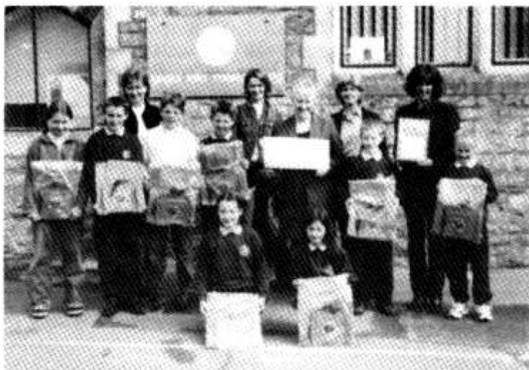
Dathlu llwyddiant - rhai o ddisgyblion Ysgol Iolo Morganwg