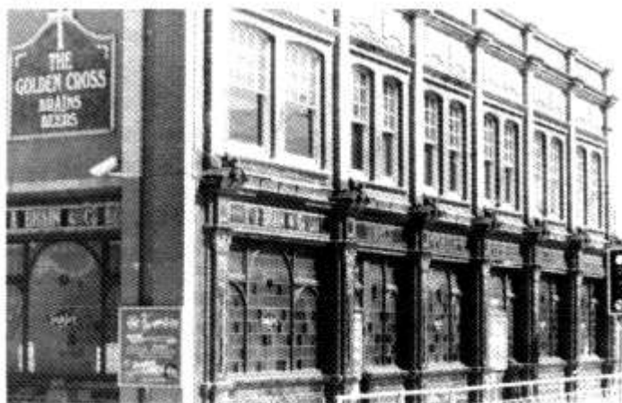
Tafarn y Golden Cross, gyferbyn â'r Maes Sglefrio