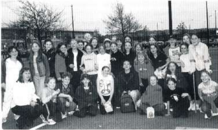
Noson allan timau merched bowlio deg

Fel diwedd glo i dymor chwaraeon llwyddiannus cafodd dimau chwaraeon yr ysgol noson allan yn yr UCI. Bu 36 o ferched Blwyddyn 7 yn bowlio deg ac yn cael bwyd yn MacDonaldis ar y ffordd adref. Da iawn pawb am eu gwaith caled yn ystod y flwyddyn.