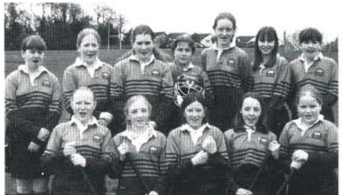
Tim Hoci yr ysgol

Llongyfarchiadau mawr i dîm hoci yr ysgol ar dymor llwyddiannus iawn. Bu'r merched yn ail mewn cystadleuaeth hoci yng Nghaerdydd a'r Fro. Da iawn pawb ar eu hymdrechion caled drwy'r tymor!