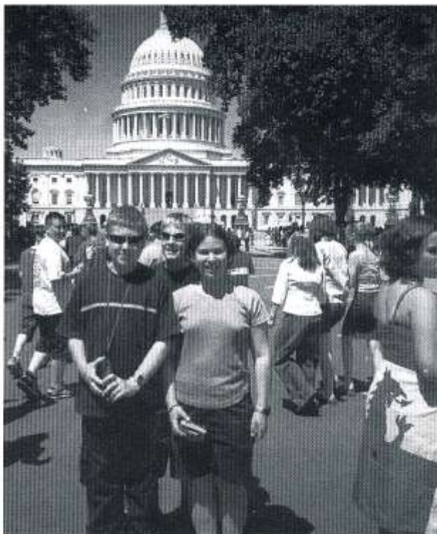
Disgyblion Plasmawr yn yr Unol Dalaithiau