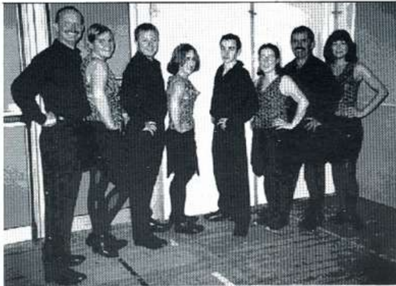
Y Clogets yn cystadlu yn eisteddfod Dinbych.