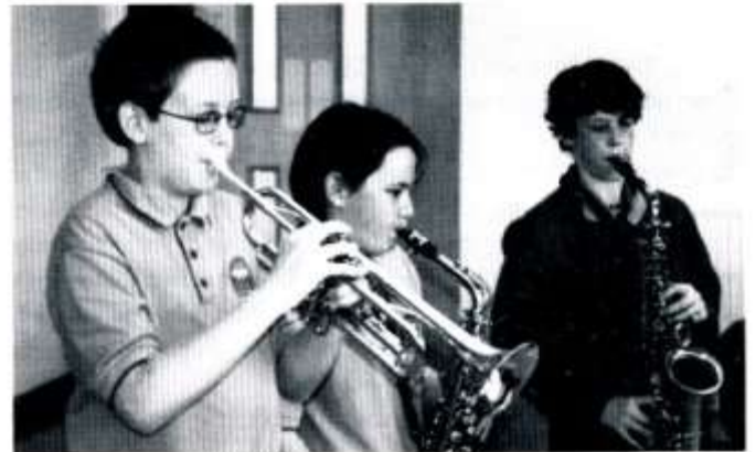
Aelodau grŵp jazz yr ysgol