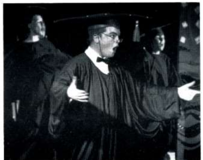
Tim cynhyrchu sioe Prima Donna , a golygfa o'r cynhyrchiad