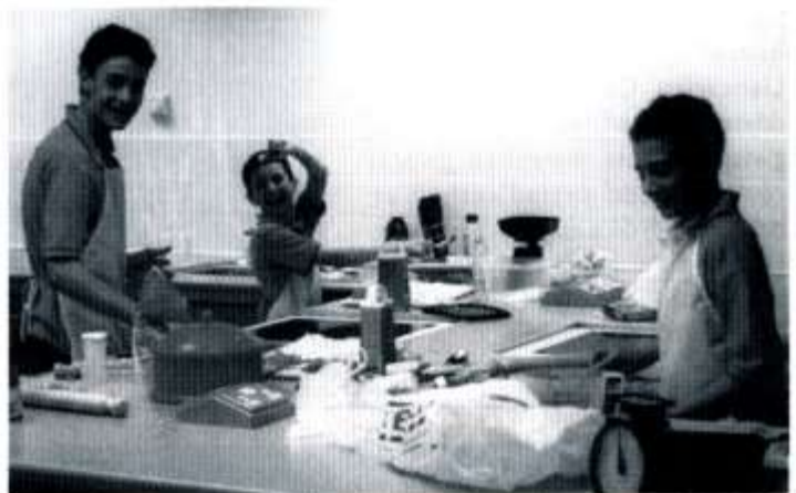
Project paratoi bwyd ar waith yn un o ystafelloedd newydd yr Adran Dechnoleg

Derbyniodd Blwyddyn 8 wahoddiad i lansio Blwyddyn Gwyddoniaeth Cymru yn Techniquet yn ddiweddar. Er mwyn ceisio creu daeargryn, neidiodd y disgyblion, ynghyd â Jane Davidson (Gweinidog Addysg y Cynulliad). Roedd pobl ledled Prydain yn neidio yn union yr un pryd.