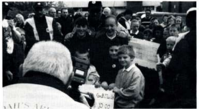
Plant Ysgol Coed y Gof yn cyflwyno sic i Ian Botham

Ar fore Sadwrn, Ebrill 27 daeth taith gerdded Ian Botham o Fachynlleth i Gaerdydd i ben. Ymdrech oedd y daith gerdded yma i godi arian tuag at Apêl Arch Noa, Ysbyty Plant Cymru. Cymru yw'r unig wlad yng Ngorllewin Ewrop heb ysbyty plant dynodedig. Cyn cychwyn ar y cam olaf o'r Ganolfan Hamdden yn y Barri daeth 6 o blant yn cynrychioli Ysgol Coed y Gof i'w gyfarch ac i gyflwyno sic am £1,700 iddo. Dyma un o'r symiau arian mwyaf a gasglwyd gan unrhyw ysgol yng Nghymru.