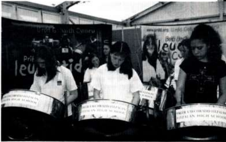
Band Dur Ysgol Uwchradd Fitzalan yn canolbwyntio yn yr Eisteddfod!