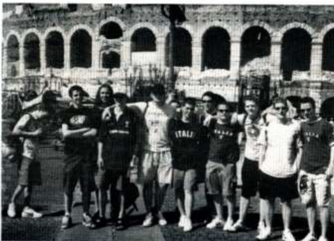
Y 'bois' y tu allan i'r amphitheatre yn Ferona