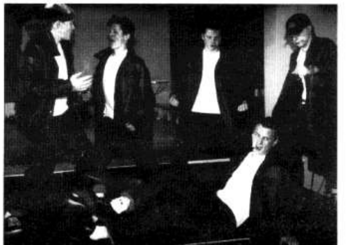
Y 'T-Birds' yn mwynhau'r dawnsio!