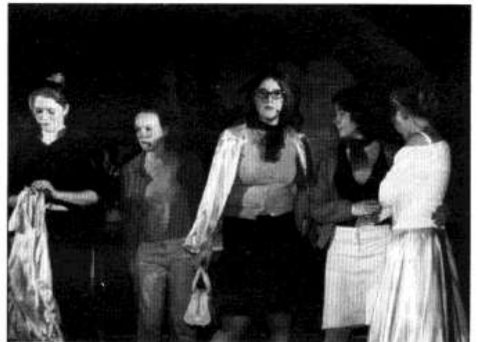
Y 'Pink Ladies' yn cysuro Sandy!