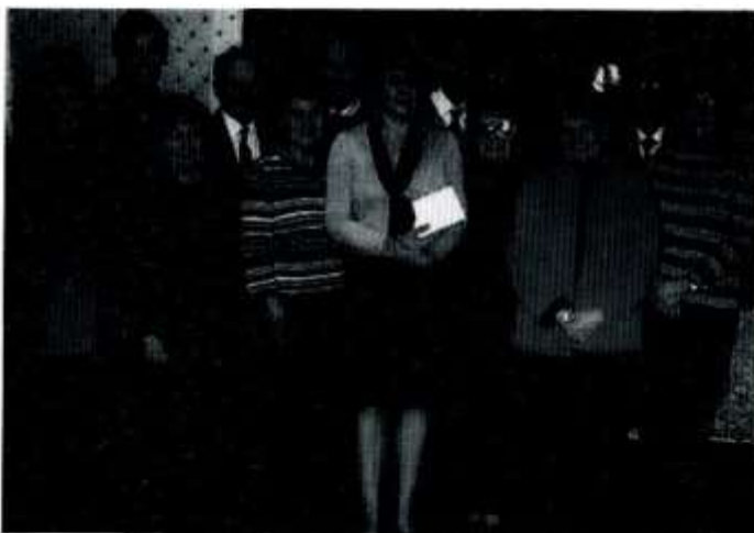
Aelodau o hwyllgor Cymdeithas Gymraeg Dinas Powys yn trosglwyddo sicc o £1200 i Pit-Pat, sefydliad sy'n gweithio i gynnal dioddefwyr y clefyd pitwidol.