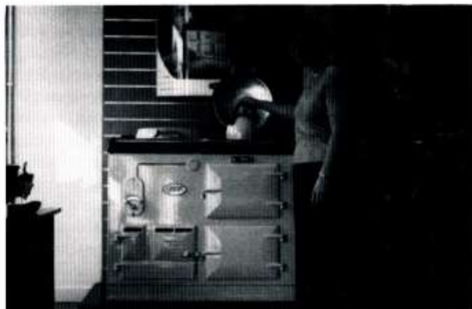
Golygfa y tu mewn i siop AGA yn Heol Caerffili

Rhwbiwch y lard a'r menyng i'r blawd ac ychwanegwch y siwgrw, y cyrens a'r sbeis. Ychwanegwch wy i wneud toes gan ychwanegu llaeth os oes rhaid.