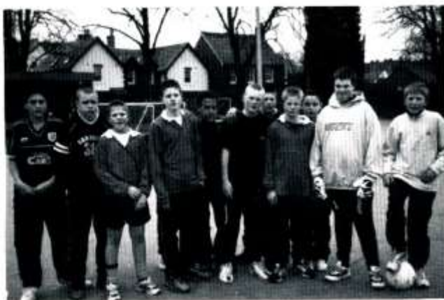
Un o'r timoedd pêl-droed yn yr Wyl Chwaraeon

Yn ogystal â'r dydd o eisteddfod cynhaliwyd diwrnod llawn o chwaraeon yng Ngerddi Soffia fel rhan o'r Wyl. Bu cystadlu brwd rhwng y llysoedd ar amrywiaeth eang o chwaraeon o denis bwrdd i bêl-droed, heb anghofio'r gystadleuaeth nofio. Ar ôl deuddydd o weithgareddau rhaid oedd mynd ati i gyfri'r holl bwyntiau ar gyfer y 'steddfod, y chwaraeon a'r gwaith cartref. Llys Dyfrig oedd y llys buddugol eleni, ond yn sicr fe elwodd aelodau pob llys wrth iddynt gymryd rhan a mwynhau yr amrywiol weithgareddau.