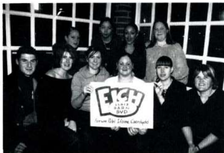
Pobl ifanc gyda'u logo newydd