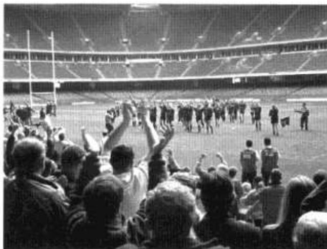
Clwb Rygbi Cymry Caerdydd yn dathlu