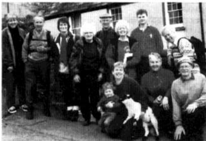
Rhai o'r pererinion gyda aelodau teulu'r Pêr Ganiedydd

Trefnwyd hefyd gyfres o deithiau cerdded fel rhan o'r dathliadau a fydd yn arwain at gofio cyfraniad Henry Richard i'r mudiad heddwch. Cafwyd dwy bererindod werthfawr iawn yn ystod misoedd Ebrill a Mai. Aeth y daith gyntaf ar ymweliad â Chapel Cefnarth a Phantycelyn, tra i'r ail fynd i ardal Cilycwm lle y cafwyd cyfle i ymweld â'r Dygoedydd, Tŷ Newydd, tŷ seiat cyntaf y diwygiad Methodistiaidd a'r Efail Fach, cartref yr emynydd Morgan Rhys. Bydd y daith nesaf, ar Ddydd Sul 22 Mehefin, yn mynd i Soar y Mynydd.