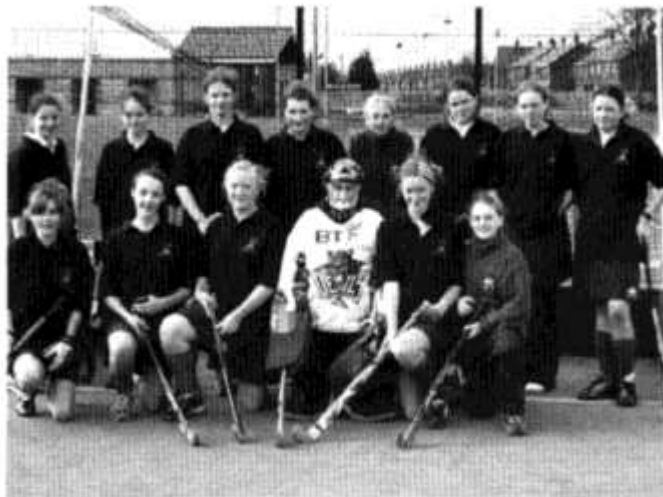
Tim hoci Blwyddyn 9

Traws-gwlad: Timoedd Bl. 8 a 9 yn ail yn y gynghrair.