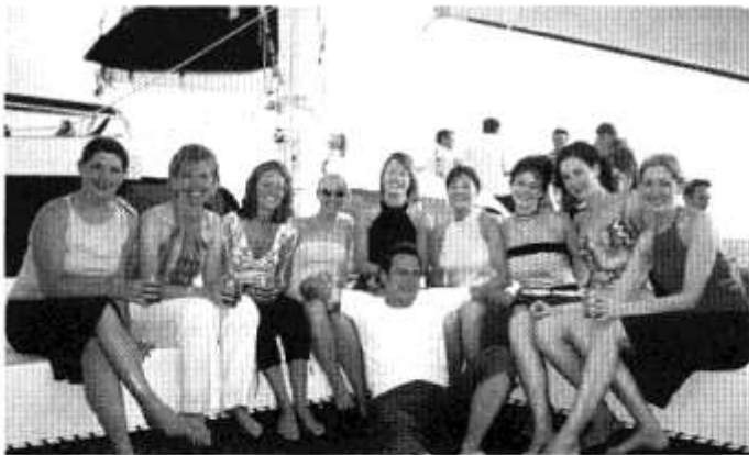
Rhai o griw'r côr yn ymlacio ar y cwch yn y Caribî