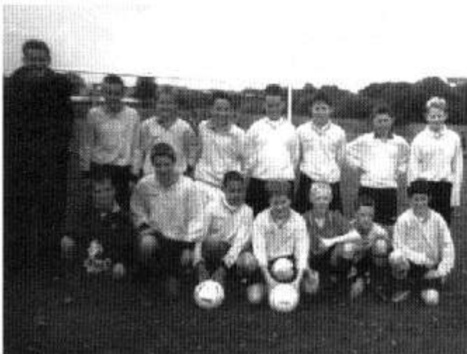
Tim Pêl-droed Blwyddyn 7

Hoffai'r ysgol longyfarch tim pêl-droed Blwyddyn 7 sy'n bencampwyr Cynghrair Gorllewin Caerdydd. Llwyddodd y tim hefyd i ennill Cwpan Caerdydd a'r Fro ar y cyd gydag Ysgol Fitzalan ar ôl iddynt gael gêm gyfartal 1-1 yn y rownd derfynol. Pob lwc iddynt ym Mlwyddyn 8!