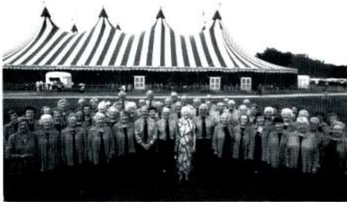
Côr Aelwyd Hamdden ym Meifod