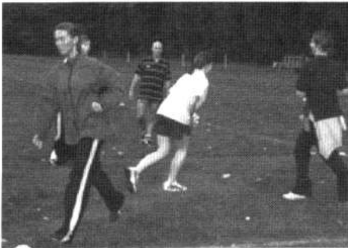
Sesiwn Ymarfer y Clwb Rygbi

Mae bron i 20 o ferched wedi ymuno â Chlwb Rygbi Merched Caerdydd erbyn hyn. Maent yn ymarfer yn wythnosol ar Faes y Deiament, yn yr Eglwys Newydd. Mae'n gyfle gwych i gadw'n heini a chymdeithasu. Mae llawer o sylw wedi bod yn barod - pwy a wŷr, efallai mewn blynyddoedd i ddod bydd merched o Glwb Rygbi Merched Menter Caerdydd yn chwarae i Gymru yng Nghwpan y Byd!!