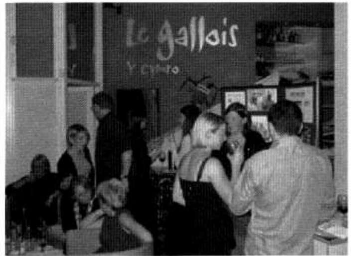
Blas ar winoedd Le Gallois