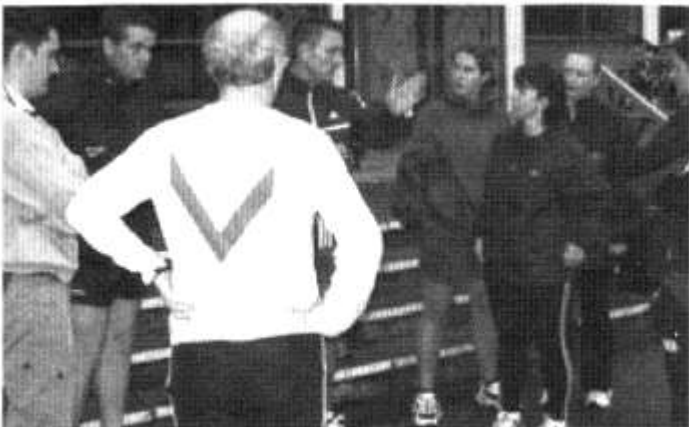
Criw'r Clwb Rhedeg yn barod i fynd!

Bwriad Clwb Rhedeg Menter Caerdydd yw cyfarfod yn wythnosol i redeg ar lwybrau penodol o amgylch Caerdydd. Mae amrywiaeth o Gymry wedi ymuno â'r Clwb - o Redwyr Marathon profiadol i bobl sydd am ddechrau rhedeg er mwyn cadw'n heini! Mae'r Clwb yn cyfarfod yn wythnosol am 6.30 yr hwyr tu allan i Ganolfan Chwaraeon Gerddi Soffia. Croeso cynnes i aelodau newydd.