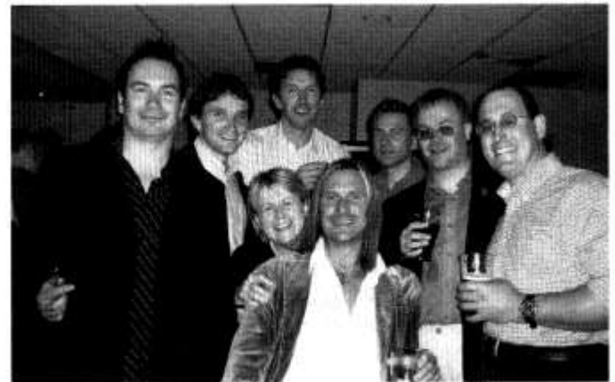
Rhai o fechgyn 1979 - 1984/86

Sut fyddwch chi'n dathlu'r Flwyddyn Newydd eleni?