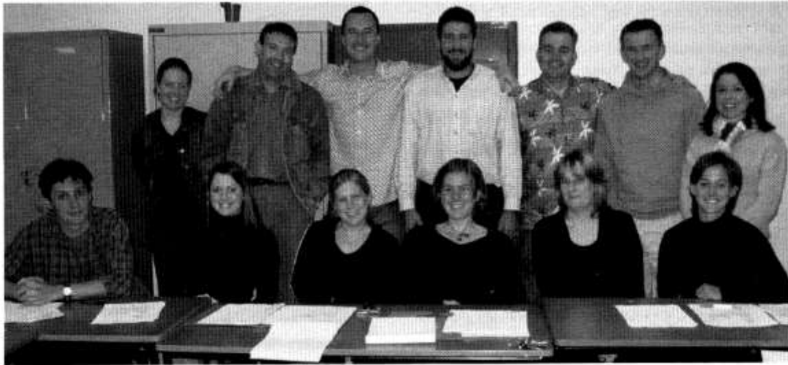
Gwersi Sbaeneg Menter Caerdydd