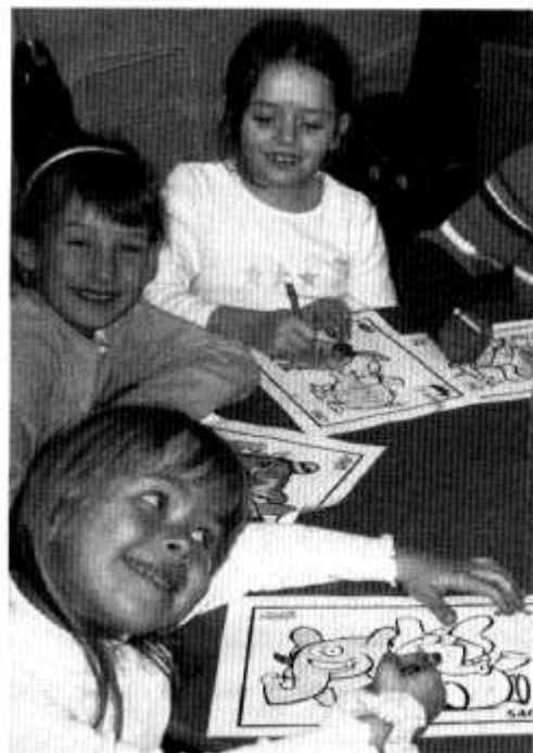
Cynllun Gofal Hanner Tymor Mwynhau yn Ysgol y Berllan Deg