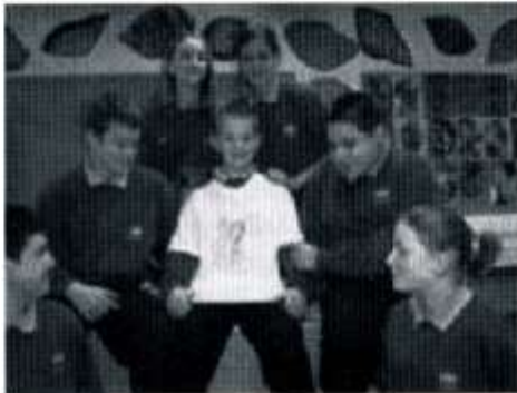
Rhai o griw "Plant mewn Angen"

Gweithgareddau eraill a drefnwyd oedd gwerthu cacennau a chrysau-T, a thawelwch noddedig gan y disgyblion a dderbyniodd groeso arbennig o frwd gan yr athrawon!