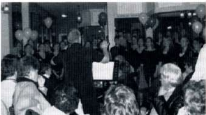
Côr CFI yn diddanu'r cannoedd a ddaeth i'r Mochyn Du ar Ddydd Gŵyl Dewi