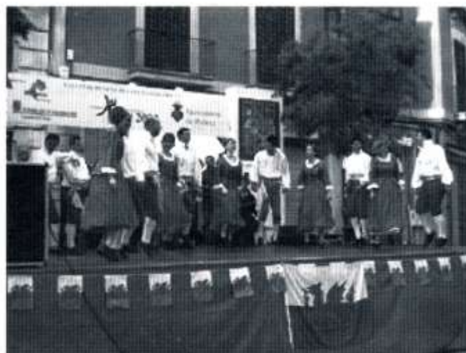
Dawnsyr Nantgarw ym Mallorca