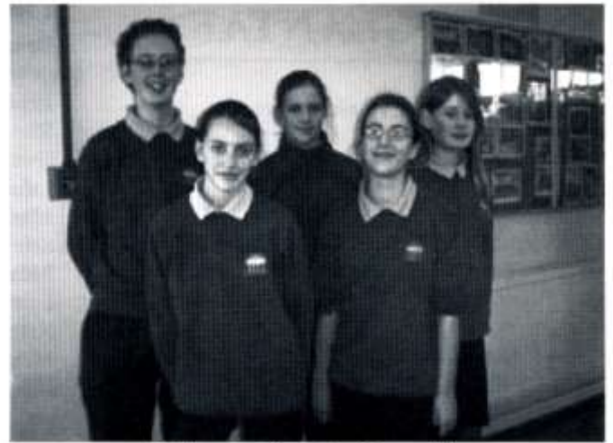
Enillwyr cystadleuaeth y Gymanwlad

I'n paratoi ar gyfer ein blas cyntaf o'r byd go iawn, bu'r disgyblion yn cael ein cynghori gan wasanaeth Gyrfaedd Cymru a gynhaliodd ddiwrnodau arbennig yn yr ysgol i roi cymorth inni. Rhai o'r gweithgareddau hynny yn yr ysgol oedd seminar ar