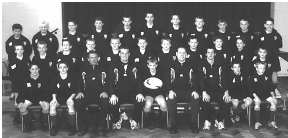
Bechgyn Rygbi Bl 7 a aeth ar daith i'r Gogledd