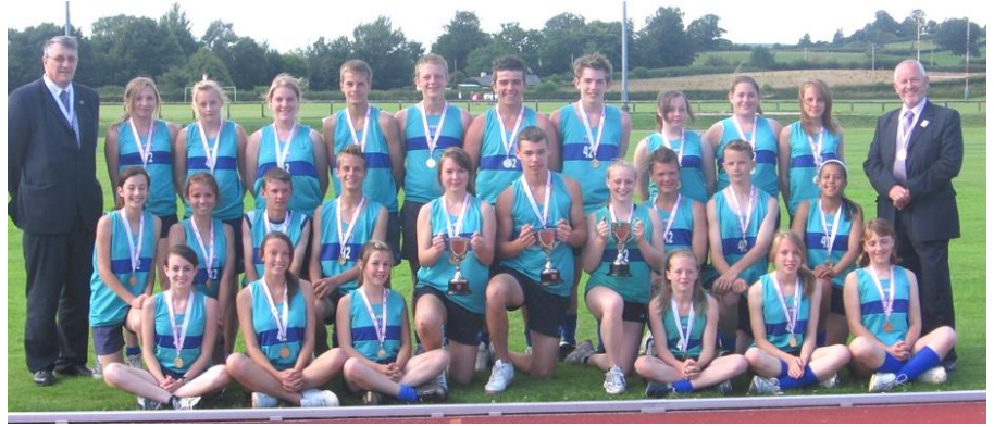
Timau Athletau Ysgol Gyfun Bro Morgannwg