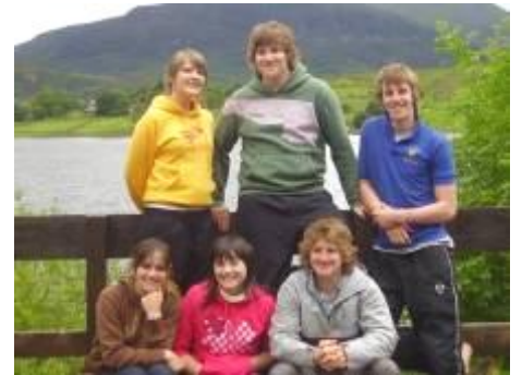
Swyddogion Blwyddyn 11 wrth ymyl Llyn Tryweryn.