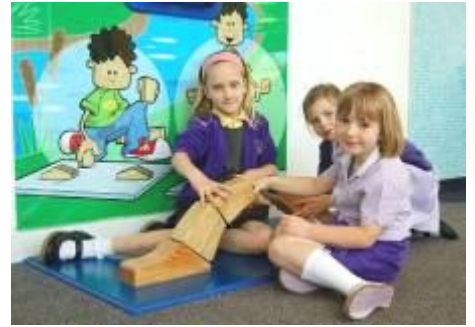
Disgyblion Ysgol Pencae yn mwynhau dosbarth gwyddoniaeth ar eu hymweliad â Techniquet.

Mae Ysgol Pencae ymhlith nifer o ysgolion sy'n defnyddio'r adnodd gwyddonol ym Mae Caerdydd i swyno plant a'u hysgogi i ddysgu mwy.