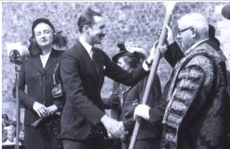
5ed Ardalydd Bute yn trosglwyddo'r brysgyll (y Mace) yn 1947

Bu llawer o ddigwyddiadau tynghedfennol yn ystod 2000 o flynyddoedd o hanes Castell Caerdydd. Digwyddodd yr un mwyaf diweddar ac arwyddocaol i bobl Caerdydd ym mis Medi 1947 pan roddodd 5ed Ardalydd Bute Gastell Caerdydd a'r tir parc o'i amgylch i bobl Caerdydd. I nodi 60 mlynedd ers trosglwyddo Castell Caerdydd, cynhelir diwrnod o ddathliadau ddydd Sul 9 Medi rhwng 9.30am a 5 pm gyda mynediad am ddim i'r tiroedd, teithiau tywys am bris gostyngol a rhaglen lawn o weithgareddau.