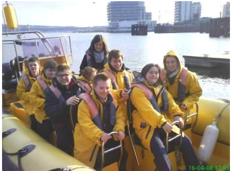
Taith rhai o blant y Clwb Sbargo ar gwch yn y bae