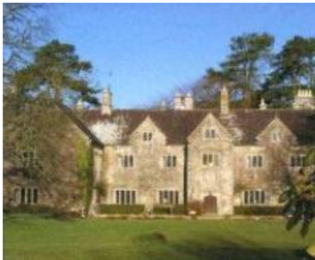
Llys Llansanwyr. (Taith Gerdded 7, Castell, Llys a Ffynhonnau)

Gyda'r haf o'r diwedd ar ein gwarthau mae golygon nifer ohonom yn troi tuag at yr awyr agored. Beth well felly na thaith gerdded hamddenol ym Mro Morgannwg? Elusen gofrestrddig sy'n cydweithio â chynghorau a chymunedau lleol er mwyn ail agor hen lwybrau a chreu rhwydwaith o lwybrau cerdded difyr yn y fro ydy Valeways . Gallwch ymuno ag un o'r teithiau tywys neu ddilyn eich trywydd eich hun gan ddefnyddio taflenni lliwgar a gyhoeddwyd ganddynt. Mae Valeways wedi cyhoeddi taflenni Cymraeg ar gyfer pob un o'r teithiau. Felly os am fwynhau ysblander y Fro - Cwm y Ceirw (Taith 17), Castell, Llys a Ffynhonnau (Taith 7) neu Goetir, Parcdir ac Arfordir (Taith 4) yna cysylltwch â Valeways , Uned 7, Canolfan Mentrau Cymunedol Y Barri, Heol Skomer, Y Barri neu ffoniwch Valeways ar 01446 749000