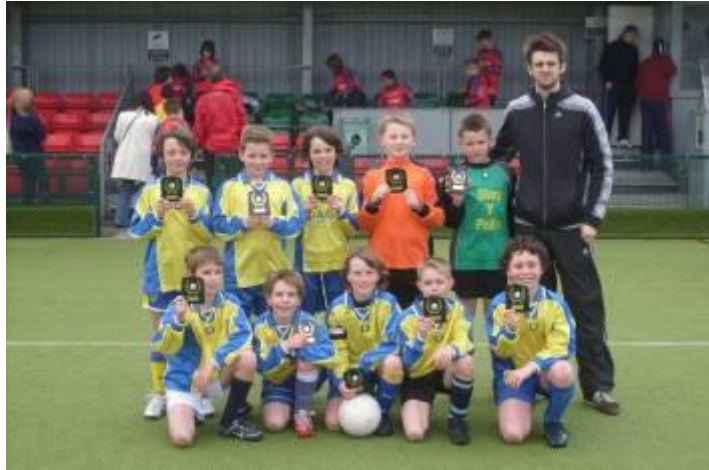
Tîm pêl-droed Ysgol Melin Gruffydd

Ar Fawrth y 17eg 2008, ymgasglodd 14 o dimau pêl-droed Cynradd Caerdydd a'r Fro yng Ngerddi Soffia ar gyfer twrnament pêl-droed saith bob ochr yr Urdd. Gyda'r enillwyr yn mynd trwodd i'r rowndiau Cenedlaethol yn Aberystwyth ym mis Mai, roedd y chwaraewyr i gyd (a'u rheolwyr awyddus!) yn frwdfrydig i gyrraedd y rowndiau terfynol.