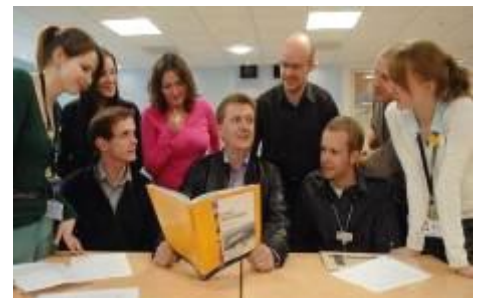
Aled Jones gyda'r dosbarth Cymraeg

Ewch i www.yganolfan.org.uk i gael manylion llawn am weithgareddau eich Canolfan chi. Wela ni chi yna!