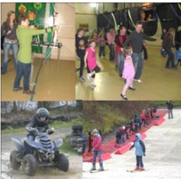
Penwythnos Teulu i Langrannog, Mawrth 28 – 30, 2008