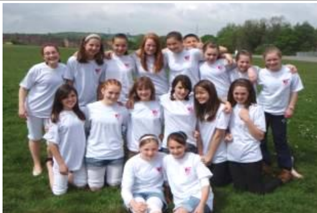
Y tîm pêl-rwyd yn Nynfaint

"Parents Get Lost" yw ystyr gwreiddiol enw gweryll "PGL", medden nhw, a doedd dim un rhiant ar gyfyl y gweryll