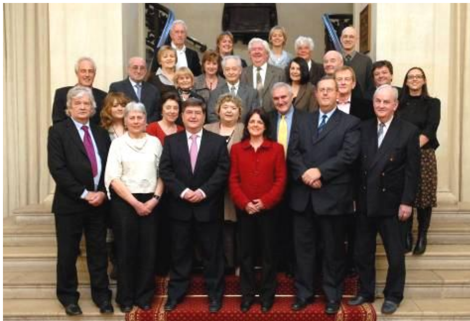
Pwyllgor Gwaith Eisteddfod Caerdydd