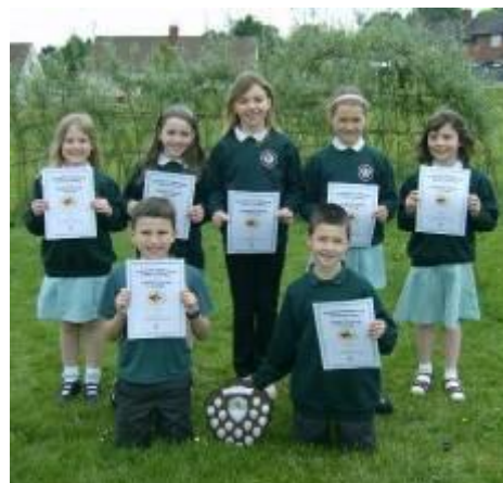
Tîm Cwis Llyfrau Blwyddyn 4