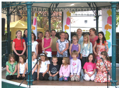
Criw Ffwrnais Awen, Menter Caerdydd a'r Urdd, fydd yn perfformio Annie ar faes yr Eisteddfod

Dymunwn bob hwyl i'r Eisteddfod, mwynhewch eich ymweliad â'r brifddinas a gwnewch y gorau o'r holl bethau sydd i'w gwneud yma.