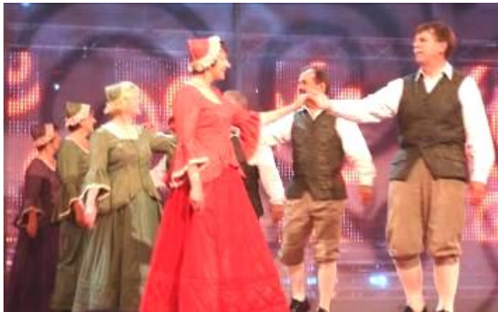
Cwmni Dawns Werin Caerdydd - un o'r llu o enillwyr

Llongyfarchiadau mawr i bawb a gyfrannodd mewn unrhyw fodd at lwyddiant diamheuol Eisteddfod Caerdydd a'r Cylch!